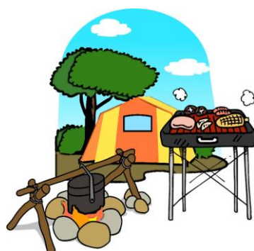
キャンプに・・・